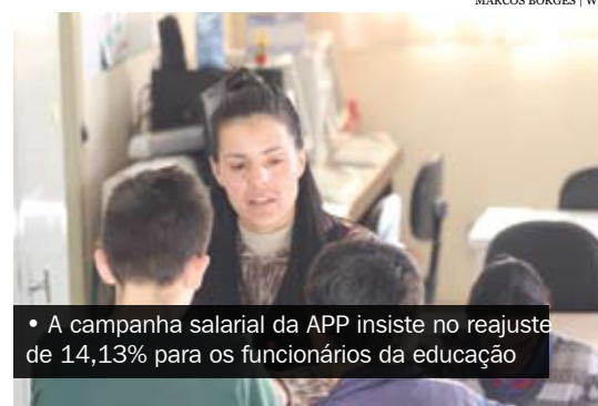
• A campanha salarial da APP insiste no reajuste de 14,13% para os funcionários da educação

Ao analisar a tabela inicial do QFEB (valor atual de R$ 784,02) em relação ao salário mínimo (atualmente é R$ 622,00) é possível concluir que os funcionários vivem em um período em que não há perdas, mas, também é fato, não existem ganhos reais nos salários. E o sinal de alerta começa a soar. A explicação é simples: quando o QFEB recebe, como vem ocorrendo nos últimos anos, apenas o índice de reajuste inflacionário, e, paralelamente, o governo federal aplica ao salário mínimo uma política de ganhos reais, tende a acontecer emparelhamento do mínimo com o valor