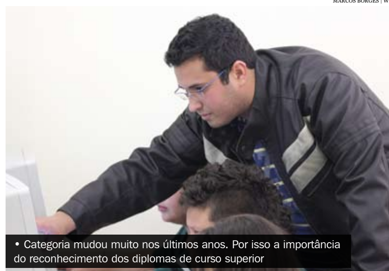
• Categoria mudou muito nos últimos anos. Por isso a importância do reconhecimento dos diplomas de curso superior

“Com esta adequação na carreira dos funcionários da educação, criamos as condições necessárias para intensificar o processo de mobilização para a implementação do Piso Salarial Profissional Nacional para todos os profissionais da educação, conforme previsto no Artigo 206 da Constituição Federal” destacou o secretário