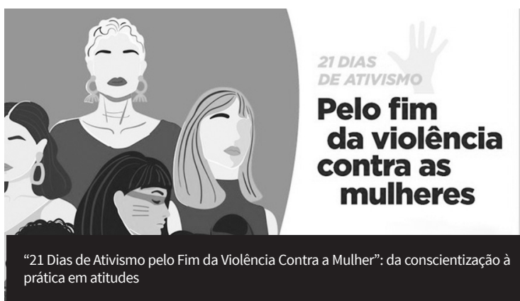
Arte: Congresso Nacional / APP-Sindicato

“Essa é uma tragédia generalizada, sem classe social. Mas, peculiarmente, atinge mais mulheres em situação de vulnerabilidade socioeconômica e racial”, explica a secretária.