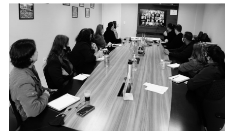
Direção estadual prepara tecnologia para lançamento do novo serviço.

A mudança também é uma investida contra os golpes, já que ao padronizar um número de whatsapp, números desconhecidos serão mais facilmente identificados como de golpistas.