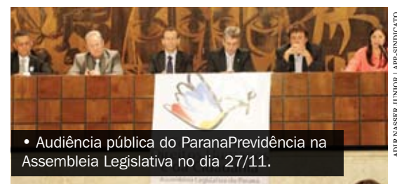
• Audiência pública do ParanaPrevidência na Assembleia Legislativa no dia 27/11.

O governo do Paraná encaminhou para a Assembleia Legislativa um novo plano de custeio para a Previdência. A versão original instituía o retorno da contribuição previdenciária para os aposentados e aposentadas. Com a reação do funcionalismo, o governo voltou atrás. A APP, juntamente com o Fórum das Entidades Sindicais dos Servidores (FES), acompanha cotidianamente o processo de tramitação do projeto na Assembleia Legislativa.