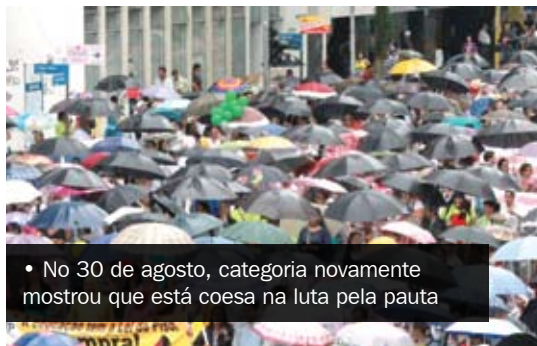
• No 30 de agosto, categoria novamente mostrou que está coesa na luta pela pauta

bém a reposição anual da inflação para os funcionários. Embora esta esteja prevista em lei, havia rumores dentro do governo de não aplicação da data-base. Ainda continuamos a luta por ganhos reais e pela imediata aprovação de alterações no plano de carreira.