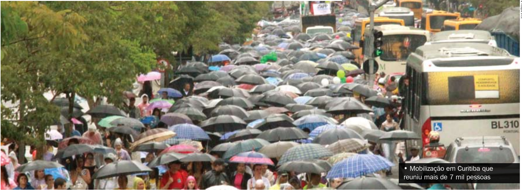
• Mobilização em Curitiba que reuniu mais de 7 mil pessoas