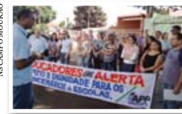
NS CAMPO MOURÃO

17 – Atos públicos dos funcionários de escola nos núcleos de educação por todo o Estado.