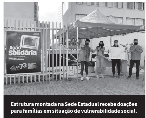
Estrutura montada na Sede Estadual recebe doações para famílias em situação de vulnerabilidade social.

A iniciativa da celebração virtual foi uma decisão coletiva da direção estadual com as direções regionais que, juntas, decidiram também pela realização de uma grande corrente de solidariedade. “Convidamos a categoria para postar imagens do trabalho e das atividades sindicais desenvolvidas em casa, nesta época de pandemia”, salienta Hermes. Além das ações virtuais o, Sindicato doará 35 mil máscaras de proteção, além de transformar, durante essa semana, os 29 Núcleos Sindicais e a Sede Estadual em pontos para doação de materiais de higiene e alimentos que serão distribuídos para famílias em situação de vulnerabilidade social, em todo o estado.