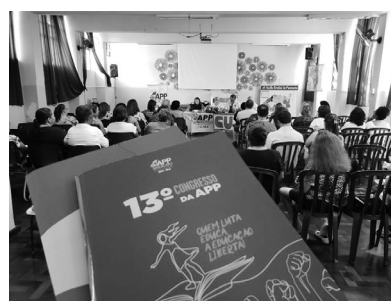
Etapla regional de Paranavaí do 13º Congresso da APP-Sindicato

A etapa estadual do 13º Congresso da APP-Sindicato será em Maringá, nos dias 27, 28 e 29 de janeiro de 2020, com cerca de 650 participantes. “Quem luta educa.